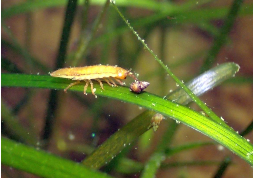
Meeresassel auf Seegras