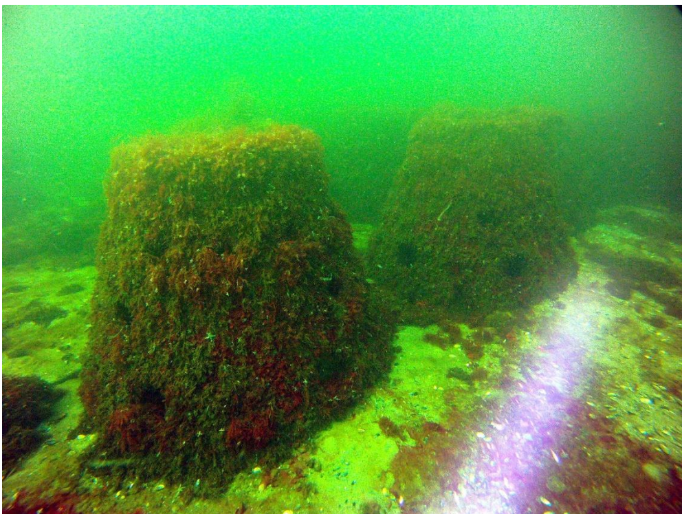
Künstliches Riff Nienhagen