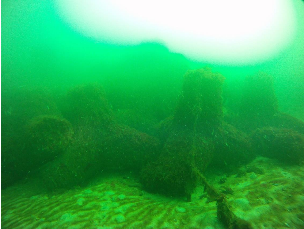
Künstliches Riff Nienhagen